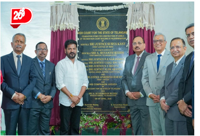
హైదరాబాద్: 2027 డిసెంబర్ నాటికి రాజేంద్రనగర్లో తెలంగాణ రాష్ట్ర హైకోర్టు తెలంగాణ హైకోర్టు నూతన భవన సముదాయాల నిర్మాణాలను పూర్తి చేస్తామని ముఖ్యమంత్రి శ్రీ ఎ. రేవంత్ రెడ్డి గారు ప్రకటించారు. హైకోర్టు కొత్త భవన సముదాయ నిర్మాణంతో పాటు రాష్ట్రంలోని వివిధ నగరాలు, పట్టణాల్లో 49 కోర్టులు, నివాస భవనాల నిర్మాణ ప్రాజెక్టులను చేపడుతున్నట్లు చెప్పారు. రంగారెడ్డి జిల్లా