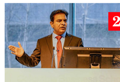
హైదరాబాద్: తెలంగాణ రాష్ట్రం అభివృద్ధి కోసం గ్రోబల్ వేదికపై కేటీఆర్ ప్రజలను పంచుకున్నారు.