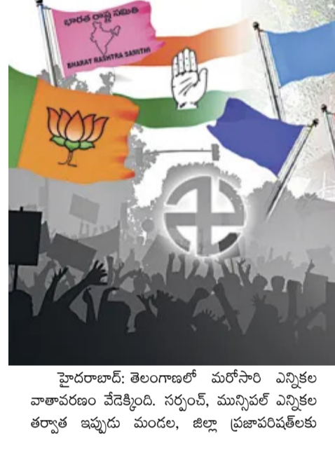
హైదరాబాద్: తెలంగాణలో మరోసారి ఎన్నికల వాతావరణం వేడెక్కింది. సర్పంచ్, మున్సిపల్ ఎన్నికల తర్వాత ఇప్పుడు మండల, జిల్లా ప్రజాపరిషత్లకు ఎన్నికలు నిర్వహించేందుకు రాష్ట్ర ఎన్నికల సంఘం (ఎన్ఈసీ) కసరత్తును వేగవంతం చేసింది. ఇందులో భాగంగా ఓటర్ల జాబితా తయారీకి మగతా.. 26

పాత నోట్ల మార్పిడికి మరో ఛాన్స్..? వైరల్ వార్తలపై క్లారిటీ ఇచ్చిన పీఐబీ రద్దయిన 500, 1000 నోట్లపై ప్రచారం.. అదంతా ఫేక్ న్యూస్ అర్జీలు ఎలాంటి కొత్త ఉత్తర్వులు జారీ చేయలేదని స్పష్టం చేసిన పీఐబీ అధికారిక సమాచారం కోసం అర్జీలు వెబ్సైట్ ను మాత్రమే చూడాలని సూచన