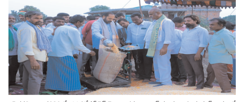
పెద్దపల్లి జిల్లా ప్రతినిధి మే 14 (లోకల్ గైడ్) తెలంగాణ సుల్తానాబాద్ మండలం, మియాపూర్ గ్రామంలో మార్కెట్ వైర్లెస్ పలు గ్రామాల సర్వండ్ లు మరియు మండల పార్టీ అధ్యక్షులు పలువురు ప్రజాప్రతినిధులు, కాంగ్రెస్ నాయకులు, కార్యకర్తలు, రైతులు, గ్రామస్థులు తదితరులు పాల్గొన్నారు.