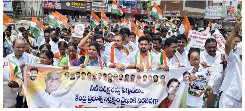
మంచిర్యాల జిల్లా ప్రతినిధి (లోకల్ గైడ్) ఎఐసీసీ, డిపీసీసీ పిలుపు మేరకు మంచిర్యాల శాసన సభ్యులు కొత్తూరు (పీఠ సాగర్) రాష్ట్ర మంచిర్యాల జిల్లా మాజీ డిపీసీసీ అధ్యక్షురాలు కొత్తూరు సురేఖ ఆదేశాల మేరకు కేంద్ర ప్రభుత్వ నిర్ణయం వల్ల నీట్ పరీక్షా పేపర్ లీకేజీని నిరసన గురువారం మంచిర్యాల నియోజకవర్గం