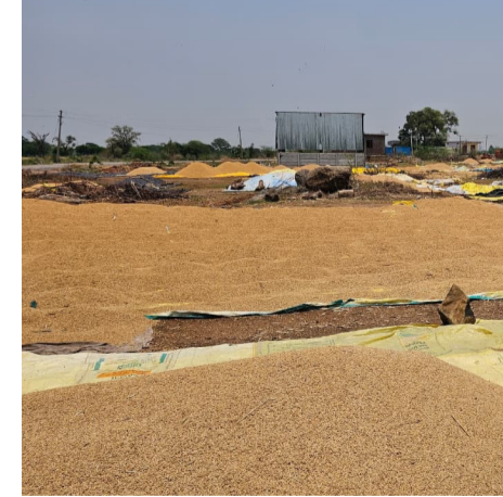
తీవ్ర ఆసహనం వ్యక్తం చేశారు. గురువారం మెండోరా మండలంలోని దూద్గామ్ గ్రామంలో ఏర్పాటు చేసిన ధాన్యం కొనుగోలు కేంద్రాన్ని ఆయన ఆకస్మికంగా సందర్శించారు. ఈ సందర్భంగా రైతులు తమ బాధలను ఎమ్మెల్యేకు విన్నవించుకున్నారు. గత 10 రోజులుగా ధాన్యం కుప్పలు పోసి ఉన్నా.. గన్సి బ్యాగులు (బ్యాగ్స్) లేవని, లారీలు రావడం లేదని రైతులు ఆవేదన వ్యక్తం చేశారు. క్షేత్రస్థాయిలో రైతుల ఇబ్బందులను స్వయంగా పరిశీలించిన ఎమ్మెల్యే డినిపై తక్షణమే స్పందించి జిల్లా అధికారి డి.ఎన్.ఓ. తో అక్కడినుండి ఫోన్లో మాట్లాడి సమస్యల పరిష్కారానికి దిశానిర్దేశం చేశారు. దూద్గామ్ మేజర్ గ్రామం అయినప్పటికీ ఇక్కడ గన్సి బ్యాగుల కొరత తీవ్రంగా ఉందని, కేవలం 6 వేల సంచులు మాత్రమే పంపడం వల్ల రైతులు ఇబ్బంది పడుతున్నారని మండిపడ్డారు. తక్షణమే సరిహద్దు బార్దాన్ పంపాలని ఆదేశించారు. కొనుగోలు కేంద్రం ప్రారంభమైనప్పటి నుండి కేవలం 3 లారీలు మాత్రమే రావడంపై ఆయన ఆగ్రహం వ్యక్తం చేశారు. కనీసం 50 నుండి 60 లారీల ధాన్యం నిల్వ ఉందని, వెంటనే లారీల సంఖ్య