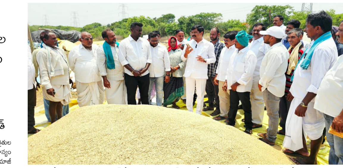
వెంచాలని కోరారు. నిజామాబాద్ లోని ముకుంద రైస్ మిల్, పార్లి ట్రేడింగ్ కంపెనీ, సిద్ది రామేశ్వర రైస్ మిల్ వంటి చోట్ల క్వింటాల్ కు 3 నుండి 4 కిలోల వరకు తరుగు తీస్తున్నారని ఎమ్మెల్యే దృష్టికి వచ్చింది. 41.5 కిలోలకు బదులు 45.5 కిలోల వరకు నింపుతున్నారని, ఇది రైతులను నిలుపునా ముంచడమేనని ఆగ్రహం వ్యక్తం చేశారు. ప్రభుత్వం మాటల ప్రకారం వెంటనే తరుగు 41.5 కంటే మించి లేకుండా ధాన్యం దింపకుండా చర్యలు తీసుకోవాలన్నారు. దూద్గామ్ సరిహద్దు గ్రామం కావడంతో అధికారులు ఇక్కడ రైతుల పట్ల వ్యక్త చూపుతున్నారని ఆవేదన వ్యక్తం చేశారు. బుధవారం

దూద్గామ్ కొనుగోలు కేంద్రంలో రైతులతో కలిసి మాట్లాడిన ఎమ్మెల్యే వేముల తరుగు' పేరిట రైతులను నిలుపు దోపిడీ చేయొద్దు డిఎన్ టి కి ఫోన్ చేసి సమస్యను వెంటనే పరిష్కరించాలని డిమాండ్