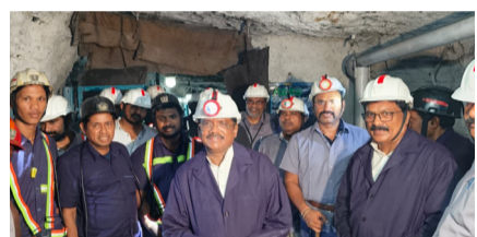
మంచిర్యాల జిల్లా ప్రతినిధి (లోకల్ గైడ్) సింగరేణి కార్మికులతో కాకా కుటుంబానికి విడదీయాలని అనుబంధం ఉందని కార్మిక, గనుల శాఖ మంత్రి గడ్డం వివేక్ అన్నారు. గురువారం మందమర్రి ఏరియాలోని

రాష్ట్ర కార్మిక శాఖ మంత్రి గడ్డం వివేక్... మంచిర్యాల జిల్లా ప్రతినిధి (లోకల్ గైడ్) సింగరేణి కార్మికులతో కాకా కుటుంబానికి విడదీయాలని అనుబంధం ఉందని కార్మిక, గనుల శాఖ మంత్రి గడ్డం వివేక్ అన్నారు. గురువారం మందమర్రి ఏరియాలోని