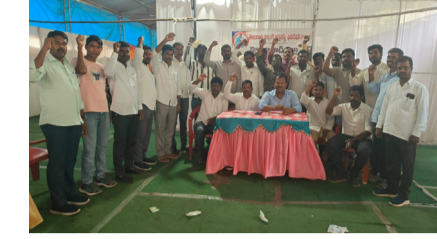
లోకల్ గైడ్, వికారాబాద్ జర్నలిస్టుల సమస్యల పరిష్కారం లో మంత్రి వేగం