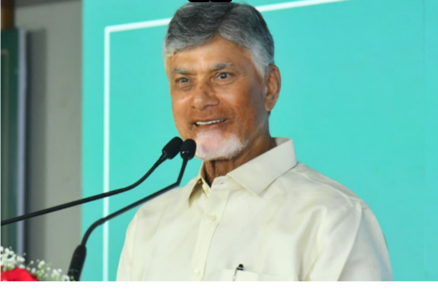
అమరావతి: దేశంలోనే తొలి క్యాంటం-సెక్యూర్ కమ్యూనికేషన్ బెడ్ బెడ్ అమరావతిలో ఏర్పాటు కానుంది. ఈ సరికొత్త ప్రాజెక్టుపై ఆంధ్రప్రదేశ్ ముఖ్యమంత్రి చంద్రబాబు హార్షం వ్యక్తం చేశారు. ప్రపంచ టెలికమ్యూనికేషన్, ఇన్ఫర్మేషన్ సాఫ్ట్వేర్ దినోత్సవం సందర్భంగా ఆయన 'ఎక్స్' వేదికగా ఈ విషయాలు వెల్లడించారు. భారత ప్రభుత్వ సమాచార మంత్రిత్వ శాఖకు చెందిన మిగతా..26

ఎస్ఆర్ఎమ్ యూనివర్సిటీ వేదికగా పరిశోధనలు - సైబర్ రక్షణ పరిష్కారాలకు కేంద్రంగా అమరావతి - మేకిన్ ఇండియా సాంకేతికతలకు ఈ ప్రాజెక్టుతో ఊతం