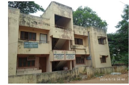
లోకల్ గైడ్ (ఖమ్మం)ఖమ్మం: ప్రభుత్వ ఆసుపత్రి ప్రాంగణంలోని ఆయుష్ అరోగ్య

కేంద్రం పై అంతస్తులో ఉన్న వనశి గదుల్లో నివసిస్తున్న 108 అంబులెన్స్ సిబ్బంది నీటి కొరతతో ఇబ్బందులు పడుతున్నారు. ప్రజలకు రాతింబవల్ల అత్యవసర సేవలందించే సిబ్బందికి నీటి సరఫరా పునరుద్ధరించేందుకు ఖమ్మం జిల్లా కలెక్టర్ తక్షణ చర్యలు తీసుకోవాలని స్థానికులు విజ్ఞప్తి చేస్తున్నారు.