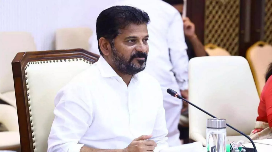
హైదరాబాద్: నరేంద్ర మోదీ సారథ్యంలోని కేంద్ర ప్రభుత్వ అసమర్థ పాలన, అనాలోచిత విధానాలతో దేశ ఆర్థిక వ్యవస్థ కుదేలైందని సీఎం రేవంత్ రిపబ్లికన్ ధ్వజమెత్తారు. కేంద్రం తాజాగా తీసుకున్న పెట్రోల్, డీజిల్ ధరల పెంపు నిర్ణయం ఏ మాత్రం సమర్థనీయం కాదని ఆయన శనివారం ఎక్స్ లో తెలిపారు. ధరల పెంపు నిర్ణయం అనేక రంగాలపై వ్యతిరేక ప్రభావం చూపుతుందని, మిగతా..26

పెట్రో ధరల పెంపు ఏ మాత్రం సమర్థనీయం కాదు ఎన్నికలకు ముందు ధరలు పెంచం అని పదే పదే ప్రకటించారు ఫలితాలు చచ్చాక లీటరుకు రూ.3 పెంచడం ప్రజల్ని వంచించడమే