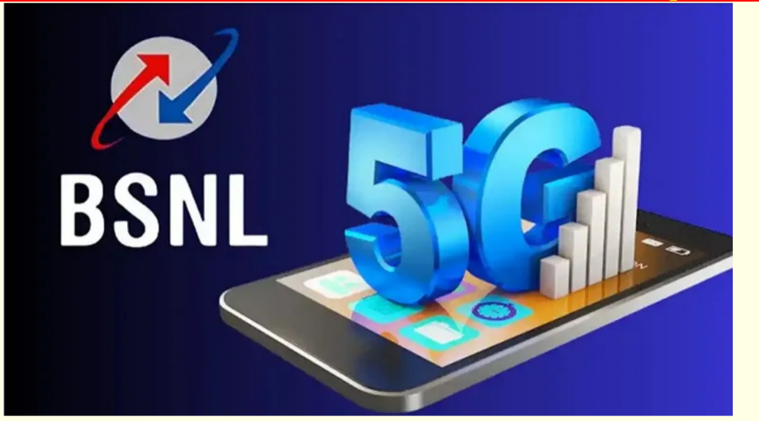
టీఎస్ఎస్ 4జీని ప్రారంభించింది. గత మే నెలలో 18,685 టవర్లలో 4జీ మొబైల్ సేవలను ఏర్పాటు చేయడానికి రూ. 2,903.22 కోట్ల ఆర్డర్ ను అందుకున్నట్లు టీసీఎస్ గతంలో తెలిపింది.