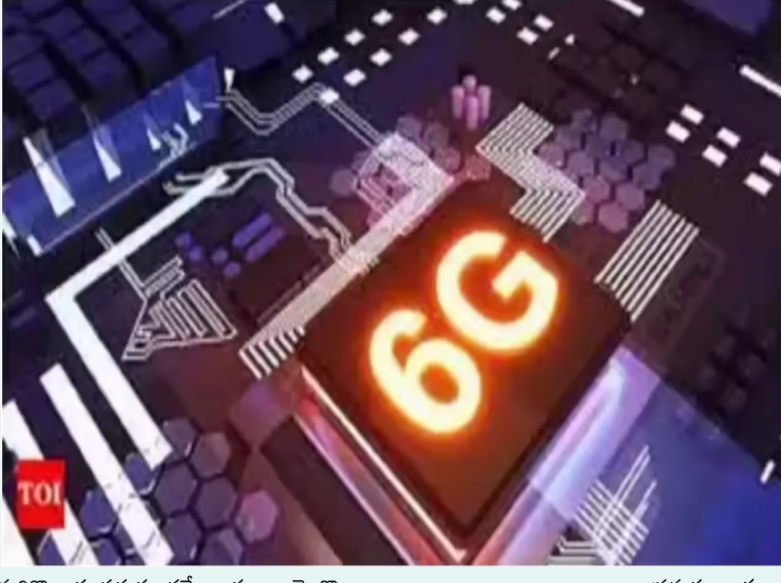
మరికొన్ని పనులను అంచనా నెలకొన్నాయి.

న్యూఢిల్లీ: 6జీ వ్యవస్థను సురక్షితంగా, స్వేచ్ఛగా, సమీక్షితంగా ఉంచేందుకు ఉపయోగపడే సూత్రాలకు సంబంధించిన ఢిల్లీ డిక్లరేషన్పై భారత్ 6జీ అలయన్స్ తో పాటు తొమ్మిది అంతర్జాతీయ సంస్థలు సంతకాలు చేశాయి. నెక్స్ట్ అలయన్స్, 6జీ డైజిట్, జపానీస్ చెందిన ఎక్స్ కె మొబైల్ ప్రమాప్స ఫోరం మొదలైనవి వీటిలో ఉన్నాయి. ఇండియా మొబైల్ కాంగ్రెస్ భాగంగా నిర్వహించిన ఇంటర్నేషనల్ భారత్ 6జీ సెమినార్ లో దీన్ని ప్రకటించారు. డిజిటల్ అంతరాలను భర్తీ చేసే విధంగా, పట్టణ, గ్రామీణ, మారుమూల ప్రాంతాల్లోనూ విశ్వసనీయమైన.. ఆఫ్ లైన్ లో కనెక్షన్ అందించే విధంగా 6జీ ఉంచాలని సంయుక్త ప్రకటనలో తెలిపారు. స్వేచ్ఛాయుతమైన, పారదర్శకమైన, నిష్పక్షపాత వాతావరణంలో ప్రపంచ దేశాల, ప్రాంతాల, భాగస్వాముల సమాన ప్రాతినిధ్యంతో ప్రమాణాలను రూపొందించాల్సి ఉంటుంది వివరించారు. పరిశోధనలు, అభివృద్ధి కార్యకలాపాలు, టెస్టింగ్, ఫైబర్ ప్రాజెక్టుల విస్తరణలతో కలిసి పనిచేయాలని పేర్కొన్నారు. విశ్వసనీయమైన టెక్నాలజీలను, ఓపెన్ ప్రమాణాలను, సుస్థిర సేవలను సమీక్షిస్తూ అభివృద్ధి చేయాలని బాధ్యతను ఈ డిక్లరేషన్ సూచించింది భారత్ 6జీ అలయన్స్ డైరెక్టర్ జనరల్ ఆర్ తేజ తిలకం. 6జీ ట్రయల్స్ 2028లో ప్రారంభమవుతాయని, వాణిజ్యపరంగా వినియోగంలోకి తీసుకురావడం