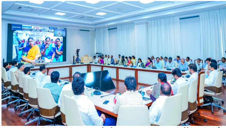
హైదరాబాద్: 'రాష్ట్ర వ్యాప్తంగా రూ. 800 కోట్లతో 8 వేల మహిళా సంఘాల భవనాలకు ఒకేసారి శంకుస్థాపన చేశాం. ఈ మేరకు ప్రభుత్వం దేశంలోనే ఒక సంవత్సరం నిర్ణయం తీసుకుంది. ఈ విధంగా మహిళా సంఘాల ఆర్థిక బలోపేతానికి పలు కీలక నిర్ణయాలు తీసుకుంటున్నాం. మహిళా సంఘాలకు మరిన్ని ఉపాధి, వ్యాపార అవకాశాలు కల్పించడమే ప్రభుత్వ లక్ష్యం. మిగతా 2 లో