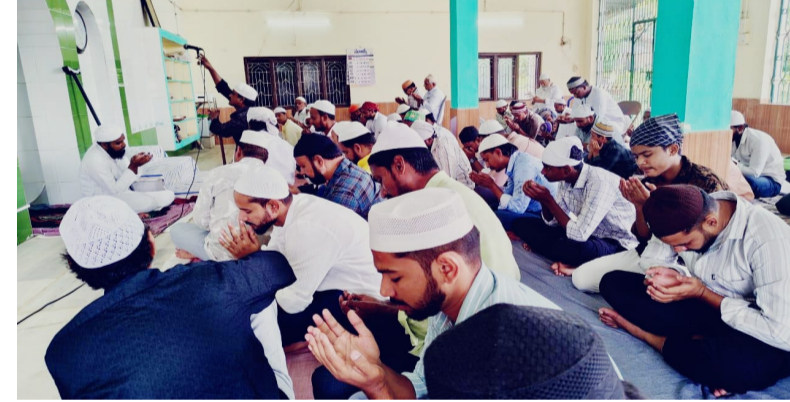
బక్రీద్ పండుగను గురువారం టి. నర్సాపురంలో భక్తికర్తలతో ఘనంగా జరుపుకున్నారు. వేడుకల ముగిసే నిర్వహించిన ముస్లిం సోదరులు లాబ్బీ సైబానుల ధర్మి, కళ్లకు సుర్రా, తలపై టోపీ, అత్తరు సునాసనలతో