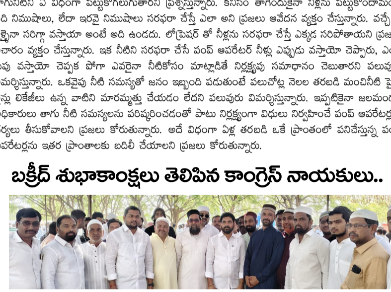
మంచిర్యాల జిల్లా ప్రతినిధి (లోకల్ గైడ్)బక్రీద్ పర్వదినం సందర్భంగా మంచిర్యాల నియోజకవర్గం మంచిర్యాల మున్సిపల్ కార్పొరేషన్ పరిధిలోని ముస్లింలకు స్టానిక కాంగ్రెస్ నాయకులు గురువారం శుభాకాంక్షలు తెలిపారు.