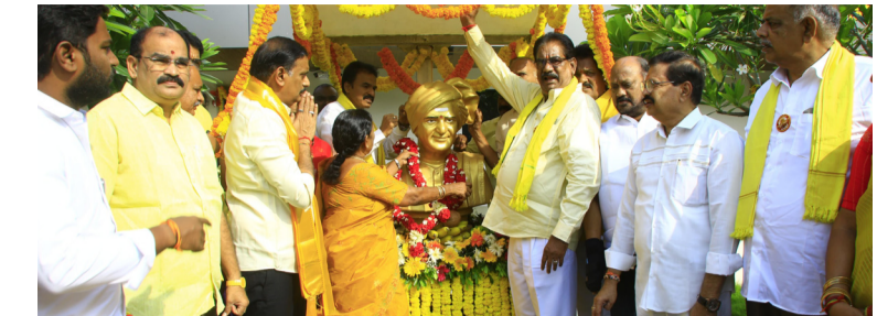
విజయవాడ విజయవాడ (ఎంపీ కార్యాలయం) విజయవాడ గురునానక్ కాలనీలోని ఎంపీ కార్యాలయం నందు ఎన్టీఆర్ 103 వ జయంతి వేడుకలు అత్యంత వైభవంగా నిర్వహించారు ఈ వేడుకకు విజయవాడ పార్లమెంటు సభ్యులు ఎంపీ కేశినేని చిన్ని ముఖ్యఅతిథిగా హాజరయ్యారు. ఈ సందర్భంగా ఆయన మాట్లాడుతూ ఎన్ని సంవత్సరాలైనా ఎన్టీఆర్ యుగపురుషుడైన కేవలం 9 నెలల్లోనే పార్టీని స్థాపించి అధికారంలోకి