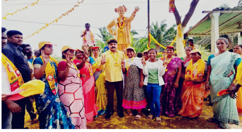
ఏలూరు జిల్లా, లింగపాలెం, మే 28 (లింగపాలెం మండలం కె.గోకవరం ఎస్సీ కాలనీలో స్వర్ణీయ నందమూరి తారకరామారావు జయంతి సందర్భంగా ఏర్పాటు చేసిన ఎన్టీఆర్ విగ్రహాన్ని చింతలపూడి