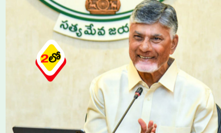
పాలకులం సేవకులం.. ప్రజల నమ్మకాన్ని నిలబెట్టాలి రెండేళ్ల పాలనపై సీఎం చెంద్రబాబు