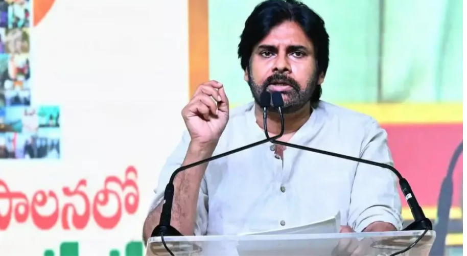
అమరావతి: ప్రజాస్వామ్యంలో అంతిమ న్యాయనిర్ణేతలు ప్రజలేనని, వారి తీర్పును మించిన శక్తి ఏదీ లేదని ఆంధ్రప్రదేశ్ ఉప ముఖ్యమంత్రి పవన్ కల్యాణ్ అన్నారు. 2024 ఎన్నికల్లో ప్రజలు ఇచ్చిన తీర్పు కేవలం ప్రభుత్వ మార్పునకు మాత్రమే పరిమితం కాలేదని, రాష్ట్ర భవిష్యత్తుకు కొత్త దిశను నిర్ణేతించింది పేర్కొన్నారు. ఆంధ్రప్రదేశ్ పునర్నిర్మాణం కోసం ప్రజలు కూటమిపై ఉంచిన నమ్మకాన్ని మగతా 2 లో