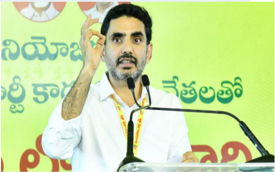
అమరావతి: రాయలసీమను 'రాయల్ సీమ'గా మార్చడమే తమ ప్రభుత్వ ధ్యేయమని, ఇందుకోసం రూ.లక్ష కోట్ల భారీ బడ్జెట్తో 'మిషన్ రాయలసీమ' ప్రాజెక్టును చేపట్టాల్సి ఉన్నామని మగతా 2 లో

విధ్వంసమే ఆయన ఎజెండా: మంత్రి లోకేశ్ రూ. లక్ష కోట్లతో 'మిషన్ రాయలసీమ' ప్రాజెక్టును ప్రారంభిస్తున్న మంత్రి జగన్ కు క్రెడిట్ చోరీ డిజార్డర్ (సీడీ) అనే జబ్బు ఉందంటూ సెటైర్లు బిస్మయ్ కు డీవర్లు కొట్టారనే కోపంతోనే జగన్ డిఎస్సీపై పగబట్టారని ఎద్దేవా ప్రజాప్రభుత్వం వచ్చాక రాష్ట్రంలో దాడులు, కబ్జాలు, హత్యలు లేవన్న లోకేశ్ డిమండ్ అంజన్ బుల్లెట్ ట్రైన్ సర్కార్ తో ఏపీలో అభివృద్ధి పరుగులు పెడుతుందన్న మంత్రి అమరావతి: రాయలసీమను 'రాయల్ సీమ'గా మార్చడమే తమ ప్రభుత్వ ధ్యేయమని, ఇందుకోసం రూ.లక్ష కోట్ల భారీ బడ్జెట్తో 'మిషన్ రాయలసీమ' ప్రాజెక్టును చేపట్టాల్సి ఉన్నామని మగతా 2 లో