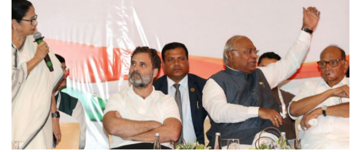
ఢిల్లీ: దేశ రాజకీయాల్లో మరో కీలక ప్రాంతీయ పార్టీలను స్థాపించిన నేతలు పరిణామానికి వేదిక నిర్వహిస్తుంటా? మళ్లీ ఆర్ గూటికి చేరబోతున్నారా? ఈ ఒకప్పుడు కాంగ్రెస్ నుంచి విడిపోయి ప్రకృత ప్రస్తుతం మగతా 2 లో

కాంగ్రెస్ లోకి తిరిగి చేరే అంశంపై టీఎంపీ, ఎస్పీ-ఎస్పీ చుట్టూ చర్చ మమతా, శరద్ పవార్ విలీనానికి సిద్ధమంటూ నానా వణోలే వ్యాఖ్యలు రాహుల్ గాంధీ నాయకత్వంలో ప్రతిపక్ష ఐక్యతకు కాంగ్రెస్ నేతల విలువు సోనియా, రాహుల్ తో మమతా-అభిషేక్ భేటీల తర్వాత ఊహాగానాలు విలీన ప్రతిపాదన వస్తే టీఎంపీ నుంచే రాహుల్ కాంగ్రెస్ సృష్టికరణ