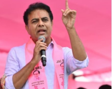
ఆయన మాట్లాడుతూ, కాంగ్రెస్ ప్రభుత్వం ప్రతి అంశానికి సిట్ దర్యాప్తులు మగతా 2 లో

ప్రతి అంశానికి కాంగ్రెస్ ప్రభుత్వం సిట్ దర్యాప్తులు ఏర్పాటు చేస్తాందన్న కేటీఆర్ మీనాక్షికి వ్యతిరేకంగా కొందరు కాంగ్రెస్ నేతలు వ్యవహరించి ఉండొచ్చని వ్యాఖ్యి పార్టీ ద్రోహులను రాహుల్ గాంధీ గుర్తించాలని సూచన హైదరాబాద్: కాంగ్రెస్ పార్టీ అంతర్గత వ్యవహారాలపై బీఆర్ఎస్ వర్కింగ్ ప్రెసిడెంట్ కేటీఆర్ తీవ్ర వ్యాఖ్యలు చేశారు. మీడియా సమావేశంలో