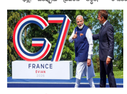
ఫిట్: ఒకప్పుడు ప్రపంచ ఆర్థిక, రాజకీయ నిర్ణయాలపై పశ్చిమ దేశాలదే పైచేయి ఉండేది. ఇప్పుడు పరిస్థితి మారుతోంది. జీ7లో సభ్యుడే కాకపోయినా.. భారత్ కు ప్రతి ఏడాది ప్రత్యేక ఆహ్వానం అందడం వెనుక ఇదే కారణమని విశ్లేషకులు చెబుతున్నారు. ప్రపంచ వేదికపై భారత్ ప్రభావం పెరగడంతో జీ7 దేశాలు మిగతా 2 లో

జీ7లో సభ్యత్వం లేదు.. అయినా భారత్ కు రెడ్ కార్పెట్ ఎందుకు? ప్రపంచంలోనే అతిపెద్ద వినయోగదారుల మార్కెట్లో ఒకటి చైనాకు చెక్ పెట్టగలిగే వ్యూహాత్మక భాగస్వామిగా భారత్ కు గుర్తింపు వాతావరణ లక్ష్యల్లో కీలక పాత్ర స్యతంత్ర విదేశాంగ విధానంతో ప్రత్యేకత