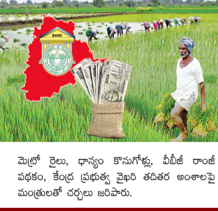
మెట్రో రైలు, ధాన్యం కొనుగోళ్లు, వీటికి రాంజీ పథకం, కేంద్ర ప్రభుత్వ వైఖరి తదితర అంశాలపై మంత్రులతో చర్చలు జరిపారు.

వానా కాలం సాగుకు సంబంధించిన ఈ నిధులను 10 రోజుల్లో జమ చేయాలి హైదరాబాద్: రైతు భరోసా నిధులను ఈనెల 30న విడుదల చేయాలని తెలంగాణ ప్రభుత్వం నిర్ణయించింది. ఖమ్మం జిల్లా మధిరలో నిర్వహించే బహిరంగ సభలో నిధులను సీఎం రేవంత్ రెడ్డి విడుదల చేయనున్నారు. వానా కాలం సాగుకు సంబంధించిన ఈ నిధులను 10 రోజుల్లో జమ చేయాలని నిర్ణయించారు. సచివాలయంలో మంత్రులతో ప్రత్యేకంగా నిర్వహించిన సమావేశంలో పలు అంశాలపై సీఎం చర్చించారు. హైదరాబాద్