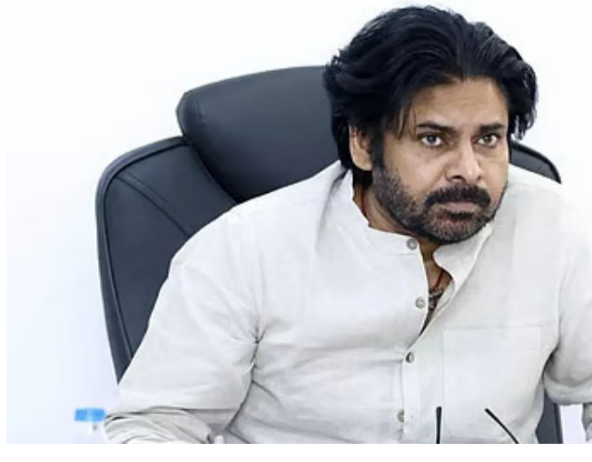
అమరావతి: ఆంధ్రప్రదేశ్ అభివృద్ధిపై కూటమి ప్రభుత్వం సరికొత్త వ్యూహాలతో స్పీడ్ పెంచింది. రాజధాని అమరావతి నిర్మాణంతో పాటు రాష్ట్రవ్యాప్తంగా మిగతా 2 లో