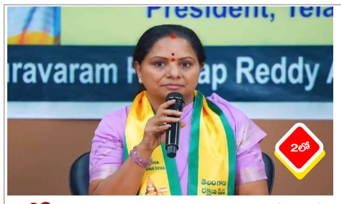
హైదరాబాద్: తన తండ్రి, బీఆర్ఎస్ అధినేత కే చంద్రశేఖర రావుతో గానీ, ఆ పార్టీతో గానీ తిరిగి కలిసే ప్రసక్తి లేదని మిగతా 2 లో

పాలనలో సాంకేతికతకు ప్రాధాన్యం.. గూగుల్తో భాగస్వామ్యం ● తప్పిలు జరగకుండా యంత్రాంగం అంతా అప్రమత్తంగా ఉండాలి ● అధికారులు క్షేత్రస్థాయి పర్యటనలు చేయాల్సింది..