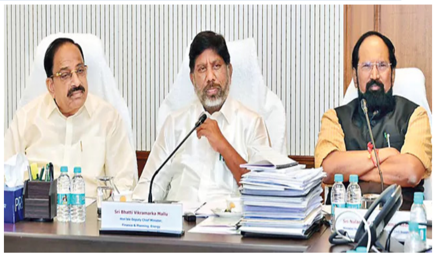
భట్టి విక్రమాభూతి తెలిపారు. వీటిద్వారా వరి సాగులో తెలంగాణ రాష్ట్రం మరింత ముందుకు వెళుతుందని వివరించారు. సచివాలయంలో వ్యవసాయ ఉత్పత్తి, ధాన్యం కొనుగోలు కార్యకలాపాలు, నిల్వ

పాలనలో సాంకేతికతకు ప్రాధాన్యం.. గూగుల్తో భాగస్వామ్యం ● తప్పిలు జరగకుండా యంత్రాంగం అంతా అప్రమత్తంగా ఉండాలి ● అధికారులు క్షేత్రస్థాయి పర్యటనలు చేయాల్సింది..