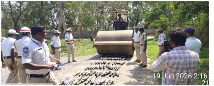
19 Jun 2026 2:16:21