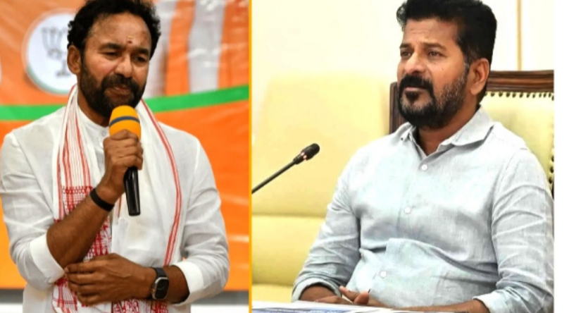
అమరావతి: ఆంధ్రప్రదేశ్ లో ముఖ్యమంత్రి రైతులను వందనోదని ఏపీసీ అధ్యక్షురాలు చంద్రబాబు నాయుడు నేతృత్వంలోని ప్రభుత్వం వైఎస్ షర్మిల తీవ్రస్థాయిలో విగళన చేసింది

అధికారులు, పత్రాలతో సమావేశానికి హాజరవుతానని వెల్లడి జూన్ 22, 23 తేదీల్లో ఢిల్లీ పర్యటనకు వెళ్లనున్న ముఖ్యమంత్రి హైదరాబాద్ : హైదరాబాద్ మెట్రో రైలు ప్రాజెక్టుకు సంబంధించిన పెండింగ్ అంశాల పరిష్కారంపై తెలంగాణ ముఖ్యమంత్రి రేవంత్ రెడ్డి దృష్టి సారించారు. ఈ మేరకు కేంద్ర రైల్వే శాఖ మంత్రి అశ్వినీ వైష్ణవ్ తో సమావేశం ఏర్పాటు చేయాలని కోరుతూ కేంద్రమంత్రి కిషన్ రెడ్డికి ఆయన లేఖ రాశారు. జూన్ 22, 23 తేదీల్లో తాను ఢిల్లీ పర్యటనలో ఉంటానని తెలిపారు. ఈ సందర్భంగా సంబంధిత పత్రాలతో వస్తానని, అధికారులతో కలిసి సమావేశానికి హాజరవుతానని ఆ లేఖలో పేర్కొన్నారు. ప్రధానంగా మెట్రో మొదటి దశకు సంబంధించిన ఐఆర్ఎఫ్ఎస్ (ఐఆర్ఎఫ్ఎస్) నిధుల విడుదల, రెండో దశ విస్తరణకు