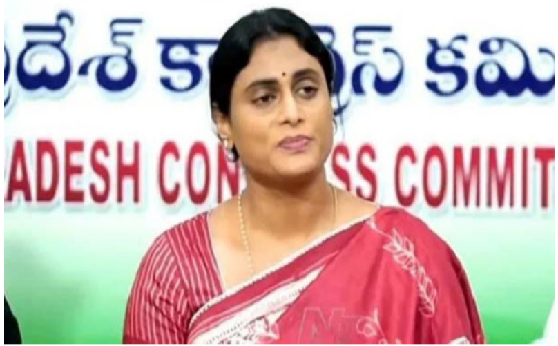
అమరావతి: ఆంధ్రప్రదేశ్ లో ముఖ్యమంత్రి రైతులను వందనోదని ఏపీసీ అధ్యక్షురాలు చంద్రబాబు నాయుడు నేతృత్వంలోని ప్రభుత్వం వైఎస్ షర్మిల తీవ్రస్థాయిలో విగళన చేసింది