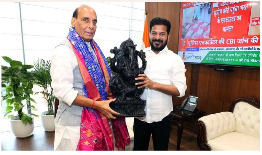
ఢిల్లీ: భారత వాయు సేన ఆధ్వర్యంలో నిర్వహించున్న ఆదిలాబాద్ ఎయిర్ ఫోర్స్ ను అన్ని వసతులతో అభివృద్ధి చేయాలని రక్షణ శాఖ మంత్రి శ్రీ రాజ్ నాథ్ సింగ్ ని ముఖ్యమంత్రి రేవంత్ రెడ్డి విజ్ఞప్తి చేశారు. ముఖ్యమంత్రి ఢిల్లీలోని రక్షణ శాఖ కార్యాలయం కరవ్య భవన్ లో

రాష్ట్ర ప్రభుత్వం తరపున అన్ని విధాలా సహకరిస్తాం ★ గాంధీ సరోవర్ ప్రాజెక్టుకు రక్షణ శాఖ భూములు బదలాయించినందుకు శ్రీ రాజ్ నాథ్ సింగ్ కి కృతజ్ఞతలు ★ ఎయిర్ లైన్స్ తమ హ్యాంగర్స్ ను ఏర్పాటు చేసుకోవడానికి సరైన ప్రదేశాలను అన్వేషిస్తున్నాయి ఢిల్లీ: భారత వాయు సేన ఆధ్వర్యంలో నిర్వహించున్న ఆదిలాబాద్ ఎయిర్ ఫోర్స్ ను అన్ని వసతులతో అభివృద్ధి చేయాలని రక్షణ శాఖ మంత్రి శ్రీ రాజ్ నాథ్ సింగ్ ని ముఖ్యమంత్రి రేవంత్ రెడ్డి విజ్ఞప్తి చేశారు. ముఖ్యమంత్రి ఢిల్లీలోని రక్షణ శాఖ కార్యాలయం కరవ్య భవన్ లో