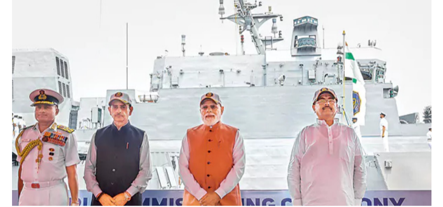
సైనికావనరాలు ప్రపంచానికి మార్కెట్ కారూ రక్షణ రంగంలో స్వావలంబన కోసం మన దేశం చేస్తున్న కృషికి ఈ నౌకలు నిదర్శం

3 నౌకల్ని ప్రారంభించిన ప్రధాని సైనికావనరాలు ప్రపంచానికి మార్కెట్ కారూ రక్షణ రంగంలో స్వావలంబన కోసం మన దేశం చేస్తున్న కృషికి ఈ నౌకలు నిదర్శం కోల్ కతా: నౌకాయానపరంగా బలమైన సామర్థ్యంతో ఉండటం.. ఏ దేశ ఆర్థిక, పూర్వోత్పత్త ప్రభావమైనా నిర్ణయించదంలో