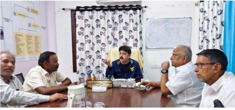
ఏలూరు జిల్లా చింతలపూడి, జూలై 6వ తేదీన జరిగిన సలహాల సుబి వచ్చిన నాయకులు, కార్యకర్తలు, ప్రజాప్రతినిధులతో క్యాంపు కార్యాలయం కిక్కిరిసిపోయింది. వారితో ఆషాఢాం