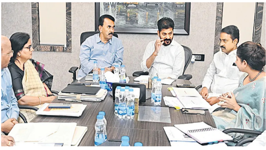
హైదరాబాద్: తెలంగాణను అంతర్జాతీయ స్థాయి పర్యాటక కేంద్రంగా తీర్చిదిద్దేందుకు రాష్ట్ర ప్రభుత్వం వేగంగా అడుగులు వేస్తోంది. ఈ దిశగా ఎంసీఆర్ హెచ్ఆర్డీలోని బోధా పెవిలియన్ లో సోమవారం ముఖ్యమంత్రి రేవంత్ రెడ్డి పర్యాటక శాఖపై ఉన్నతస్థాయి సమీక్ష నిర్వహించారు. రాష్ట్రంలోని పర్యాటక ప్రాంతాలను ప్రపంచ స్థాయి ప్రమాణాలతో అభివృద్ధి చేయాలని అధికారులను మిగతా 2 లో