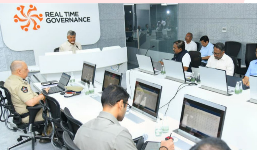
అమరావతి: ప్రజల నుంచి వచ్చే ఫిర్యాదులు, సమస్యలపై రియల్ టైమ్ లో స్పందించే ఉండాలని, ప్రభుత్వ సేవల్లో వేగాన్ని పెంచాలని ముఖ్యమంత్రి చంద్రబాబు అధికారులకు స్పష్టమైన దిశానిర్దేశం చేశారు. ఐదు రోజుల జిల్లా పర్యటన ముగించుకుని అమరావతికి చేరుకున్న మిగతా 2 లో