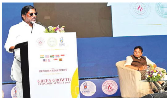
ప్రపంచవ్యాప్తంగా కార్పొరేట్ కంపెనీల గురించి చర్చిస్తున్న సమయంలో, తెలంగాణ పీపుల్స్ క్రెడిట్ అనే కొత్త భావనను తరచుకు తెచ్చింది

“ఏవ అంటే కేవలం క్లౌడ్ కంప్యూటింగ్, సర్వర్లు మాత్రమే కాదని, టీనినెనుక విద్యుత్, నీరు, భూమి, మానవవనరుల భాగస్వామ్యం ఉంటుంది పెట్టుబడులను ఆహ్వానించడంలో రాష్ట్రం దూకుడుగా ఉన్నప్పటికీ, అవి పర్యావరణానికి మేలు చేసేలా ఉండాలి