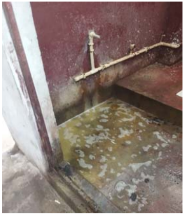
లోకల్ గైడ్, ( కొండుర్ ): తలుపులు లేవు... నడవడా నిషేధం లేదు... ముక్కుపూలూదారే దుర్వాసనతో కొండుర్ గురుకుల పాఠశాలలో