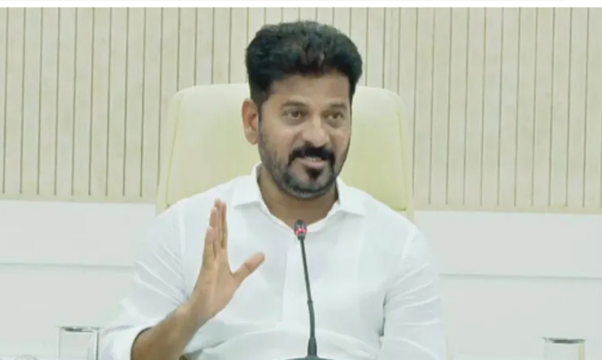
హైదరాబాద్: ప్రభుత్వ శాఖల్లో పనిచేస్తున్న బెటసోర్నింగ్ ఉద్యోగులకు వేతనాల చెల్లింపుల్లో జాప్యంపై సీఎం రేవంత్ రెడ్డి తీవ్రస్థాయిలో మండిపడ్డారు. మిగతా 2 లో