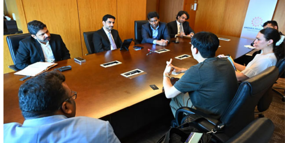
అమరావతి: ఆంధ్రప్రదేశ్ లో పెట్టుబడులను ఆకర్షించడమే లక్ష్యంగా రాష్ట్ర ఐటీ, విద్యా శాఖల మంత్రి నారా లోకేష్ చేస్తున్న పర్యటనలో కీలక ముందడుగు పడింది. దక్షిణ కొరియా పర్యటనలో భాగంగా, ప్రపంచ ప్రసిద్ధి చెందిన పాదరక్షలు, వాటి అనుబంధ పరికరాల తయారీ సంస్థ 'బూ యంగ్ గ్రూప్' యాజమాన్యంతో ఆయన జపిసిన చర్చలు ఫలప్రదమయ్యాయి. రాష్ట్రంలో తయారీ యూనిట్ ఏర్పాటుకు బూ యంగ్ గ్రూప్ సానుకూలత వ్యక్తం చేసింది. మిగతా 2 లో